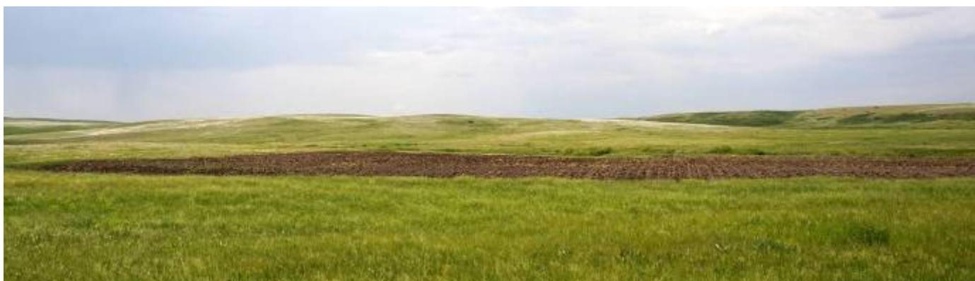
Распашка 2 га в границах земельного участка 63:15:0607003:4

По итогам работы ГЭК распашка прекращена и в настоящее время не проводится.