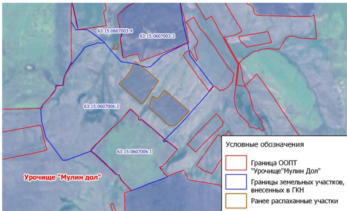
Спутниковый снимок Landsat-8 от 04.09.2016.