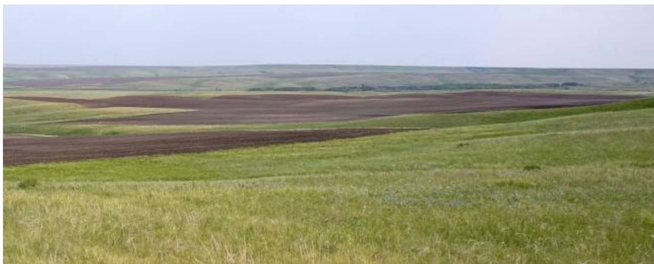
Распашка 47 га в границах земельного участка 63:15:0607006:2