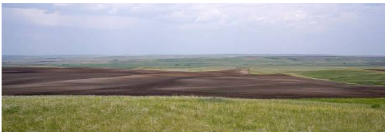
Распашка 44 га в границах земельного участка 63:15:0607006:2

На территории памятника природы "Мулин дол" выявлено три участка распашки целинных степных территорий, общей площадью 93 га. В том числе, 47 га и 44 га в границах земельного участка 63:15:0607006:2, находящемся в общей долевой собственности; 2 га в границах земельного участка 63:15:0607003:4, находящемся в общей долевой собственности.