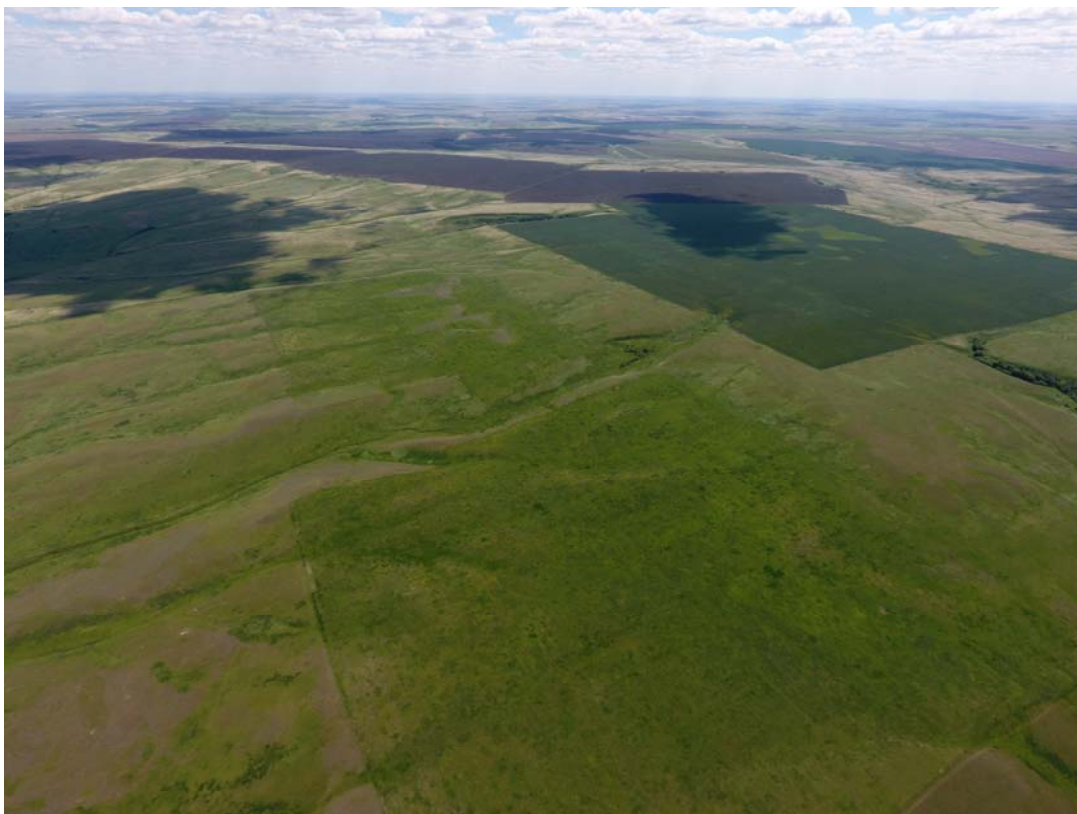
Участки не распахивались.